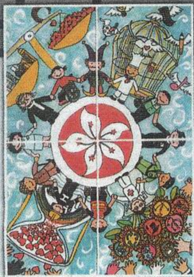
公民教育郵票設計比賽亞軍