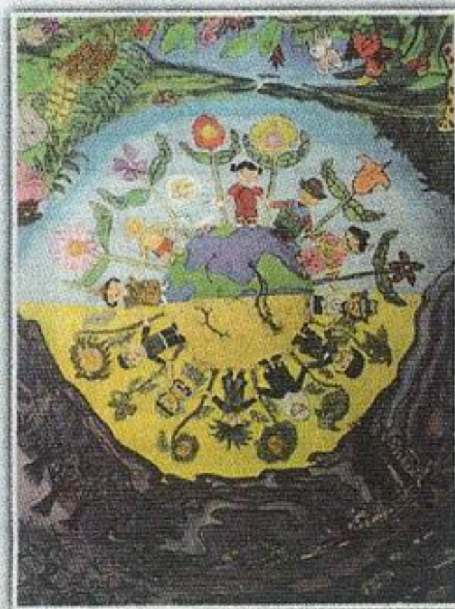
聯合國第15屆國際兒童環境繪畫比賽冠軍

地球分成兩邊，一邊樹木遭砍伐，工廠排出廢氣，花草樹木很傷心；另一邊海水清澈，動物開心地生活，帶出愛護環境的信息！