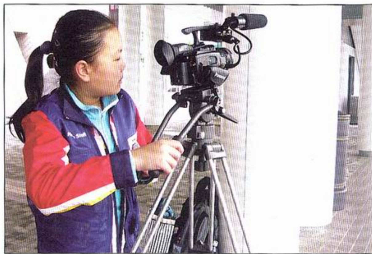
參加拍攝比賽能增加學生對事物的認識，讓他們多留意周遭的事物。

由信興科技舉辦的09/10年度KWN會員大會及工作坊吸引共34間學校參加，讓同學學習到更多演技及拍攝技巧，為接下來的拍攝比賽作好準備。信興科技學校工程組助理總經理香文偉先生表示：「KWN其實已經有超過20年的歷史，至今共有25個國家及地區，超過十二萬名學生曾參與此活動。各參賽學校可以利用『環境生態』和『溝通』作為拍攝短片的主題；『環境生態』一向都是熱門話題，至於『溝通』的內容也很廣泛，可以包含藝術、文化以至運動等範疇。我們希望作品以小朋友的角度，用創新的手法去表達他們怎樣去觀察周遭的人和事。」