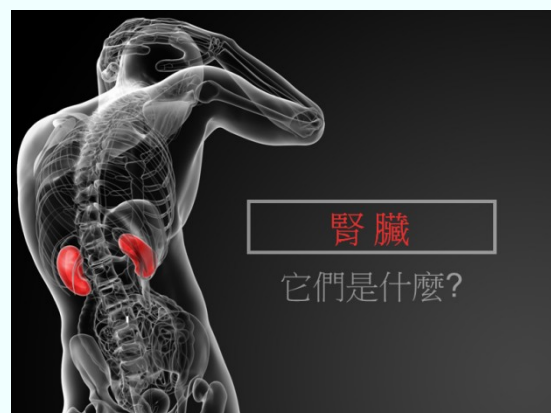
12至16歲 英文版 中文版